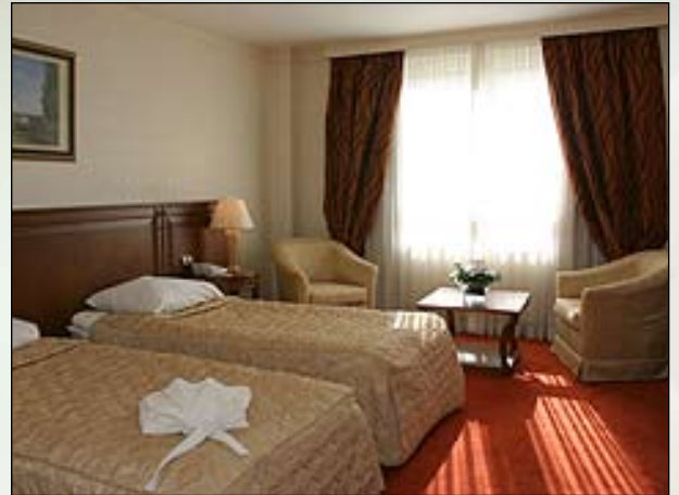
Hotel Crystal Palace Boutique Hotel