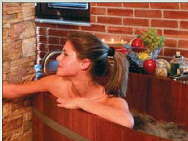
Man bør ikke snyde sig selv for et bad i vin under besøget hos Todoroff. Såvel det danske kronprinspar som daværende statminister Anders Fogh har nydt godt af de luksuriøse omgivelser på Hotel Todoroff