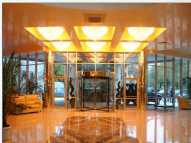
Hotel Merian Palace