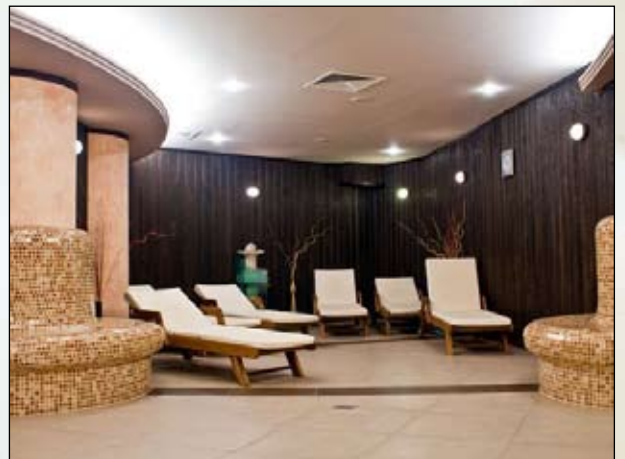
Lækre spa-faciliteter på Hotel Hissar