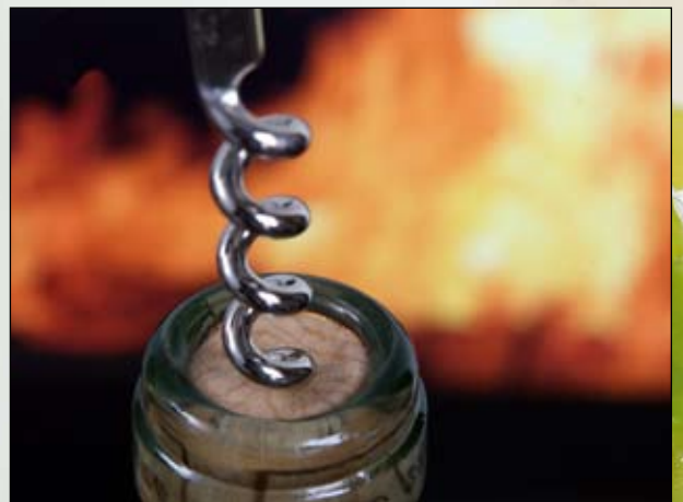
Vinsmagning i Pomorie