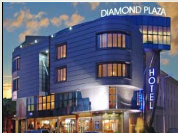
Diamond Plaza Hotellet er centralt placeret i Haskovos bymidte